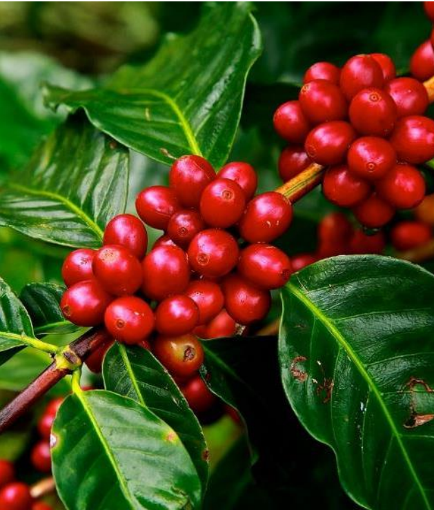
Agricultura y agro-procesamiento