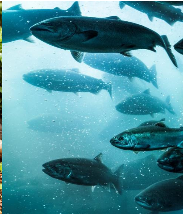
Pesca y acuicultura