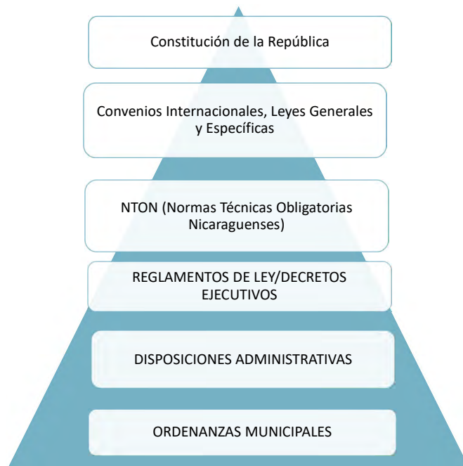
Figura 1: Resumen de Instrumentos Jurídicos que conforman el Marco Legal Forestal, atendiendo jerarquía de la Pirámide Jurídica.

A continuación, un breve esquema de la pirámide jurídica.