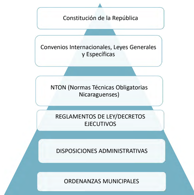
Figura 1: Resumen de Instrumentos Jurídicos que conforman el Marco Legal Forestal, atendiendo jerarquía de la Pirámide Jurídica.

A continuación, un breve esquema de la pirámide jurídica.